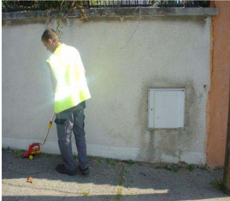
Coupe Bordure expérimenté à Net4 Système électrique rechargeable